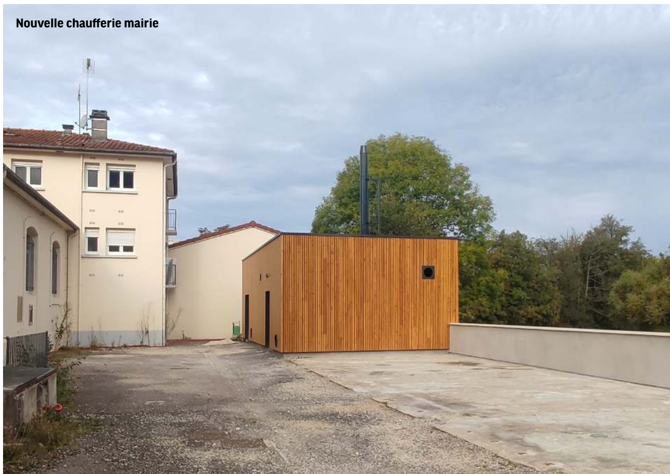
Nouvelle chaufferie mairie

Economies par rapport au fioul : 22 000 € / an