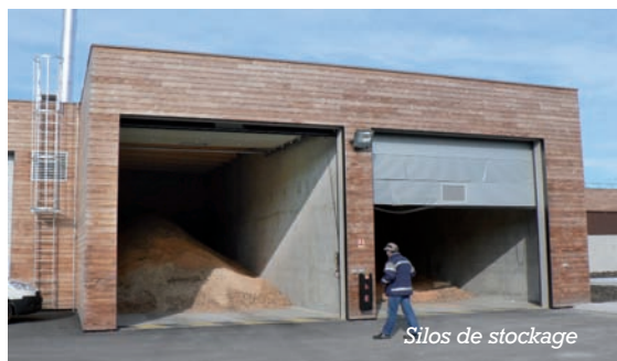
Silos de stockage