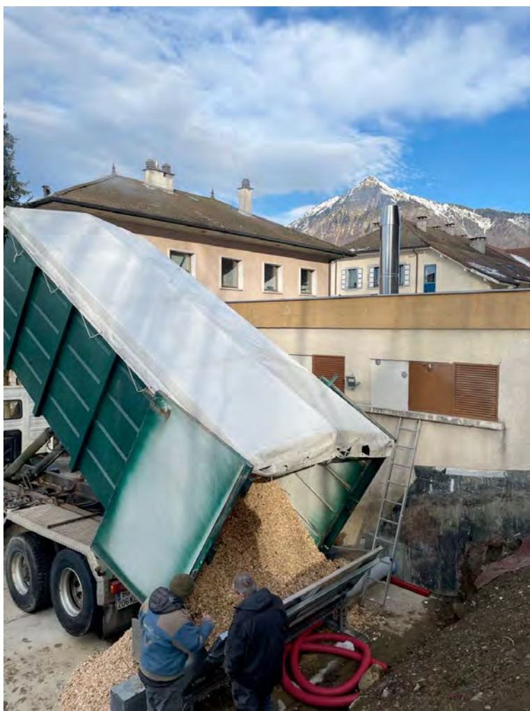
Un approvisionnement en plaquettes forestières en circuit ultra court à Chatillon-sur-Cluses en Haute-Savoie.