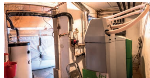
Local chaufferie avec chaudière, ballon d'eau chaude et silo textile (au fond)