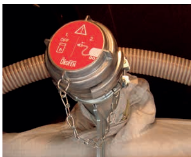
Raccord de remplissage du silo