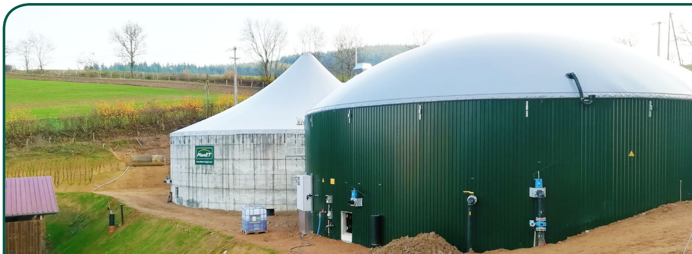
Taille de l'installation: 160 kW | Mise en service: Mars 2019