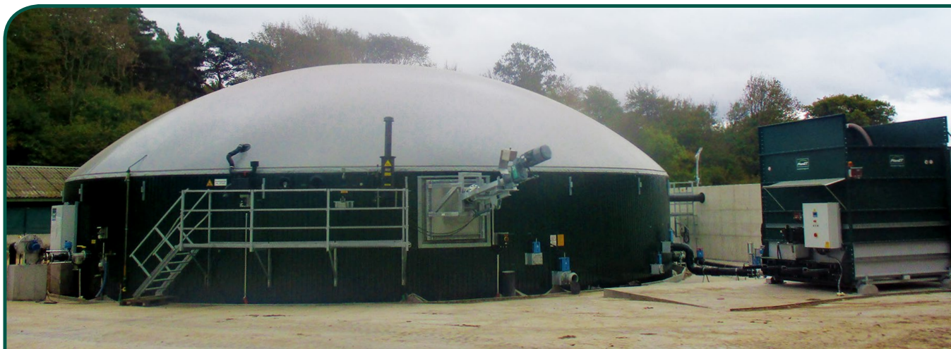
Taille de l'installation: 250 kW | Mise en service: Novembre 2018