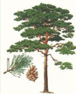
Pin Morris "Toute la nature" Bordas

PM : Expérimentez une saison avec du bois sec de 2 ans !