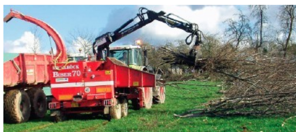
Déchetage par la Cuma Ecovaloris

Entretien : deux fois/an réalisé par les associés.