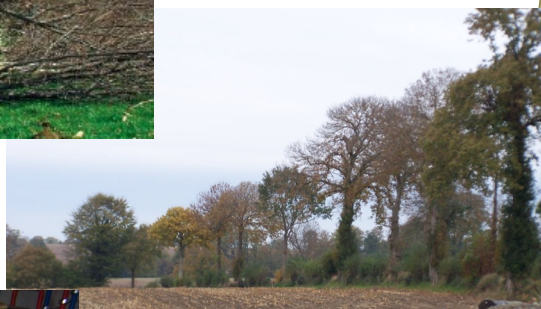
Linéaire de haie de l'exploitation