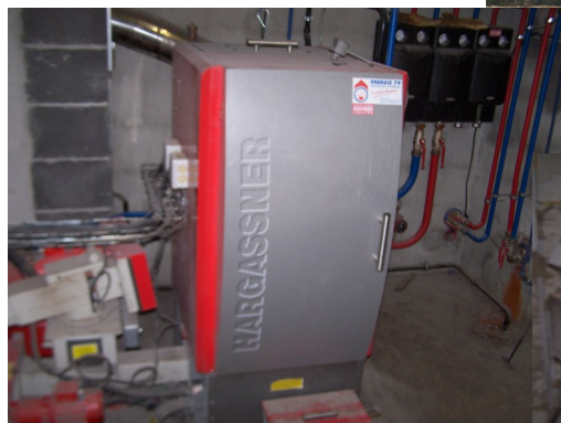
Chaudière Hargassner 55 KW