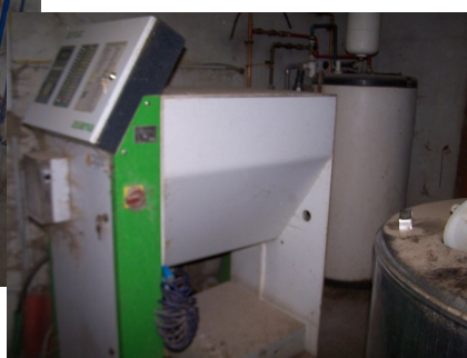
DAL: Distributeur automatique de lait pour l'alimentation des veaux gras.